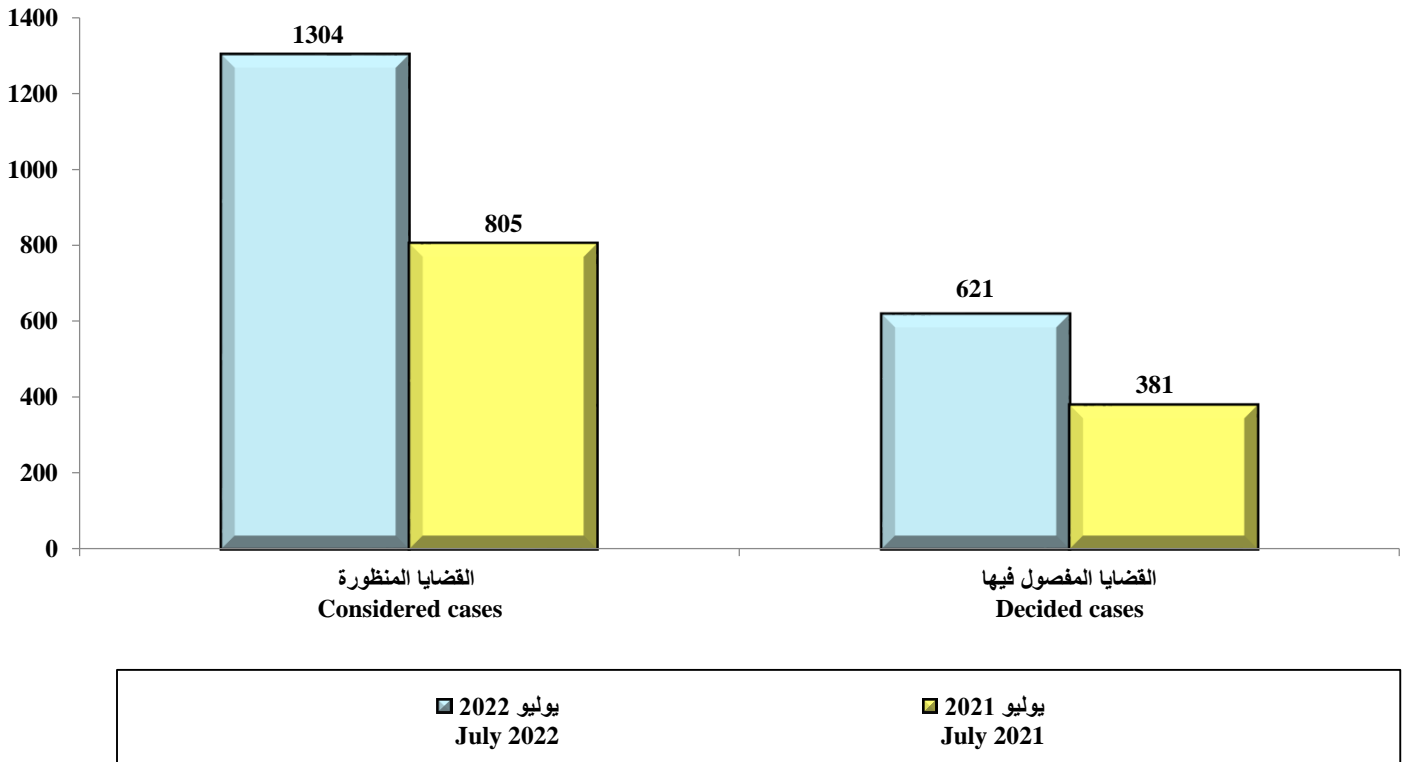
Chart ( 2 ) Number of considered and decided cases in traffic courts during July 2022 in comparisons with the same month from the last year