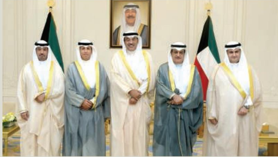
ولي العهد خلال استقباله الوسمي والصفران والغنام والسميط