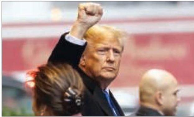
ترامب يتمتع ببعض الحصانة

أربع تهمة جنائية فيدرالية في العاصمة واشنطن بمحاولة إلغاء فوز بايدن، في انتخابات 2020. ويعيد الحكم القضائية إلى المحكمة الابتدائية، لتحديد متى وما إذا كان ترامب سيمثل للمحاكمة. وكان الموعد الأصلي للمحاكمة في قضية الانتخابات هو 4 مارس، أي قبل وقت طويل من الانتخابات المقررة في نوفمبر المقبل. وكتب ترامب على شبكته للتواصل الاجتماعي «تروث سوشال»، «أنه انتصار كبير لديموقراطيتنا ودستورنا، أنا افتخر بكوني أميركياً». في المقابل، ذكرت فريق حملة الرئيس جو بايدن، في بيان، «فقد دونالد ترامب عقله بعدما خسر انتخابات 2020 وشجع عصابة على قلب النتائج... يعتقد بأنه فوق القانون وهو مستعد للقيام بأي شيء من أجل الوصول إلى السلطة والبقاء فيها».